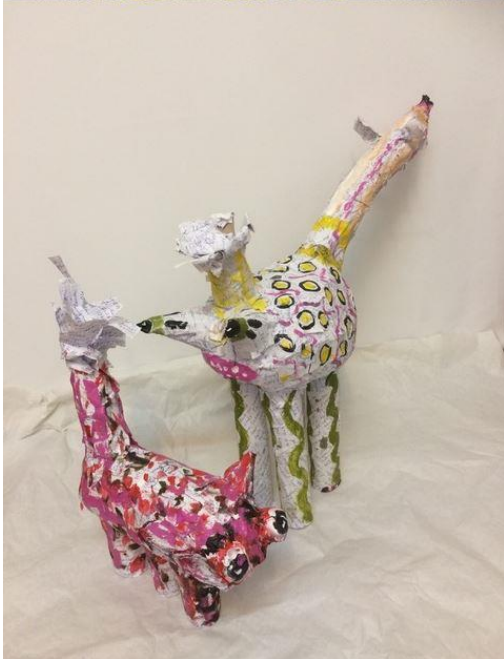
Serie Papierarbeiten: Inner-irdische 1 – 3, Papier, Pappe, Leim 2020)