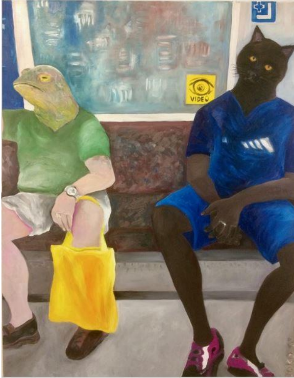
Serie Tiere: HIPPOHippies (Öl a. LW 2020) 2019)